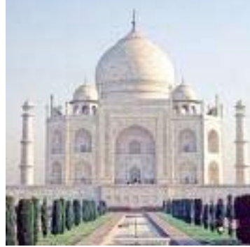
above: Dolmabache palace left: Taj Mahal below: Mihrimah Sultan