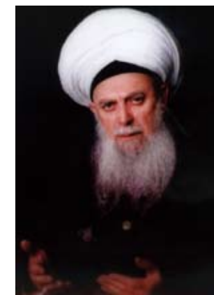
Mawlana Sheikh Nazim