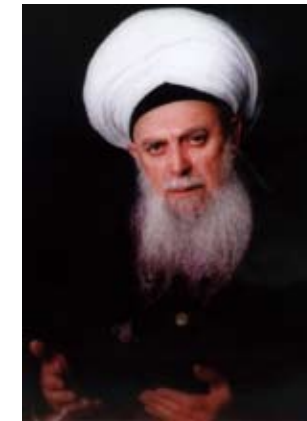
Mawlana Sheikh Nazim

“faidesiz işler uğraşmayınız, çünkü faidesiz işlerle uğraşmak hayatınızı törpüler ve dünyadan hiç bir faydeli iş yapamadan sönen, bir yıldız gibi, kaybolup gidirsiniz!”