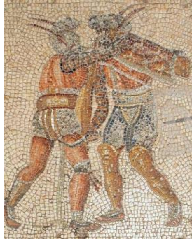
“Ancient Greece, the originator of Democracy and, interestingly enough, of Sport too as public entertainment”

citement!” This saying of yours, however, is threadbare and has no real substance!