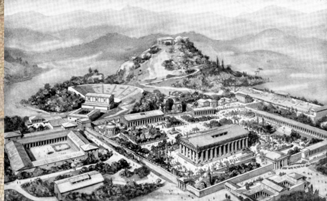
“Çok ilginçdir, Yunanistan hem Demokrasinin çıkış noktası, aynı zamanda ilk defa sporun da bir halk eğlencesi haline geldiği yerdir.”

edilirdi. Bu SALTANAT NİZAMında KUDRET ve HEYBET, HİZMET ve LİYAKAT asıldı-esastı. Bu TÜRK MİLLETİNİN DEĞİŞMEZ TÖRE siydi.