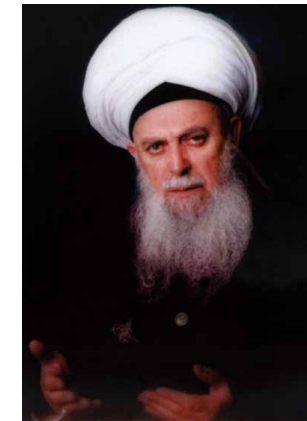
Mawlana Sheikh Nazim

VOL. 2, ISSUE 14: 18 RABİ AL-AKHİR 1431 2 APRIL 2010