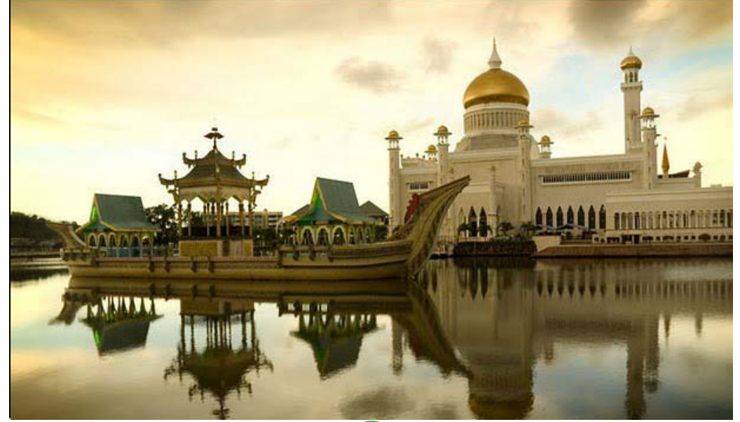
Omar Ali Saifuddin Mosque, Brunei