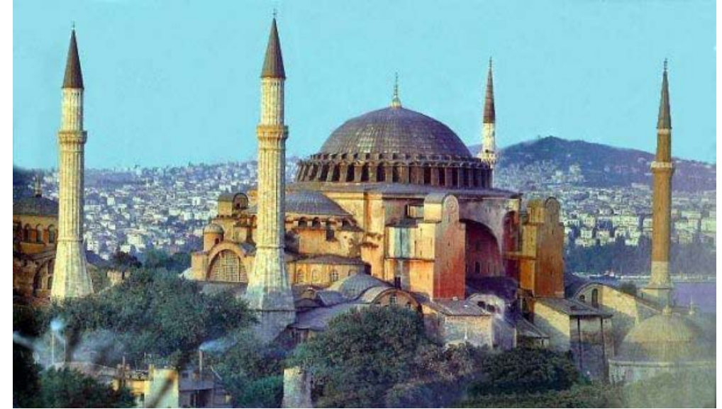
537 yapılmış kilise, 1453'dan sonra camiye çevrilmiştir. 1934 sonra muze olarak acildi.