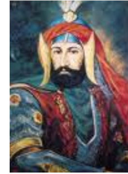
Sultan Murad Han IV

Ey irtica, sen ne mubareksin ki seni Parlamentolardan atmışlardır!