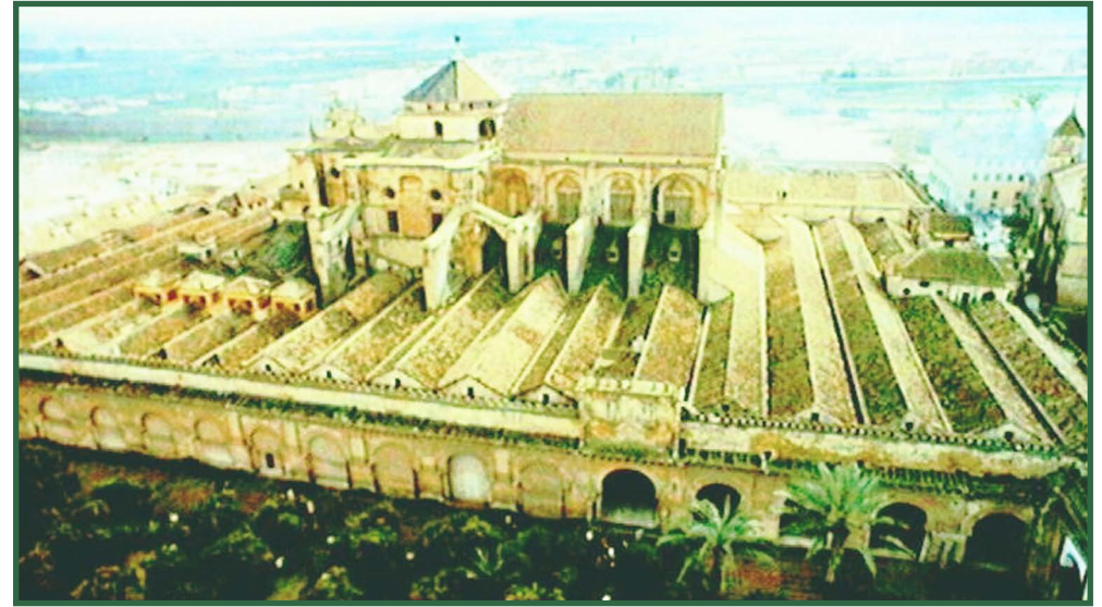
Endülüs Emevilerinin başkenti Kurtuba'nın 600 camisinin en ihtişamlısı Kurtuba Camii'dir 786'da.