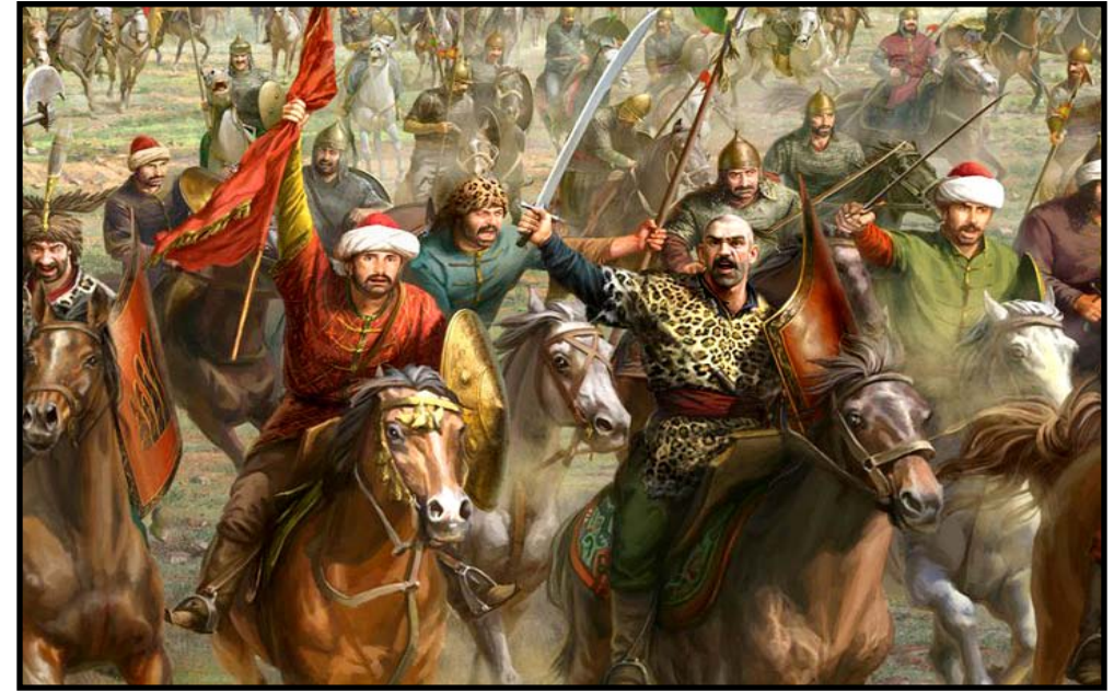
İslamın Azameti ve İhtişamı

This army that marched from Salonika to Istanbul what schemes did they scheme and what acts did they commit? Why is this not being taught to our young people?