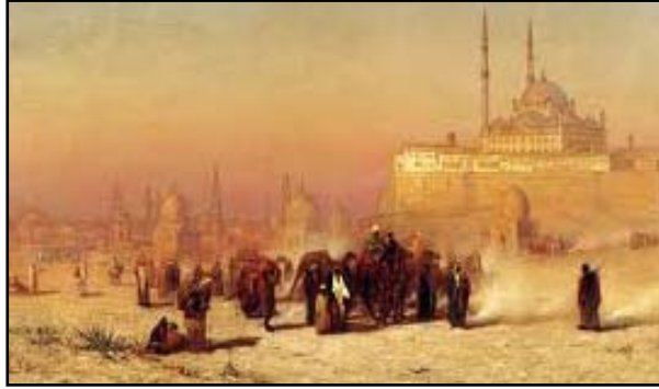
The citadel in Egypt

Demokrasi Neleri Götürmüştür? Demokrasi denilen en Dejenere en mantıksız İDARE SİSTEMİ Milletlerin kadimden beri biriktirdikleri bütün maddi ve manevi değerlerini yağmalamıştır. Maddi zararı manevi zarar çok fazla geçmiştir. Çünkü DEMOKRASİ denilen çılgınlık idaresi milletlere verdiği hudutsuz hürriyetle Dinlerin getirdiği Bilhassa İSLAMIN getirdiği bütün Disiplini süpürmüş Din ve inancı vicdanlara